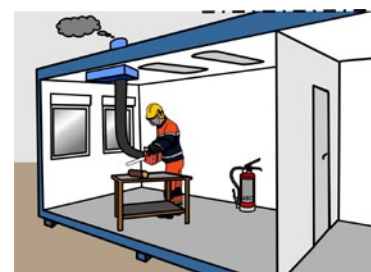
Rys. 3. Instalacja wyciągowa dla narzędzi spalinowych stosowanych wewnątrz pomieszczeń zamkniętych