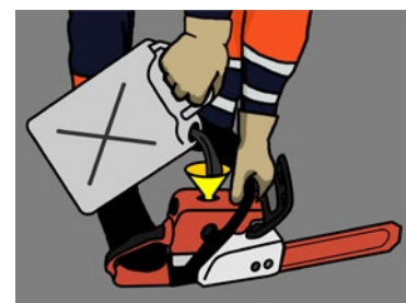
Rys. 2. Prawidłowy sposób uzupełniania paliwa w narzędziach spalinowych